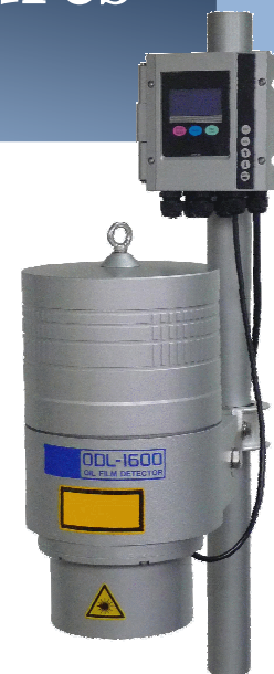
ODL 1600 Tête + transmetteur

Sortie 4...20mA , Modbus ...pour alarme ou automate