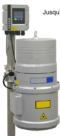
ODL 1610 Jusqu'à 10m de détection