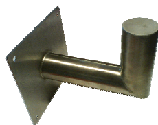
Support mural pour transmetteur