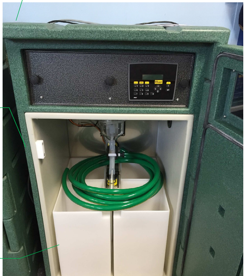
Appareil présenté : 4 flacons

Armoire robuste en PE thermoformé Gamme de température d'exploitation : de -25 à +40° C